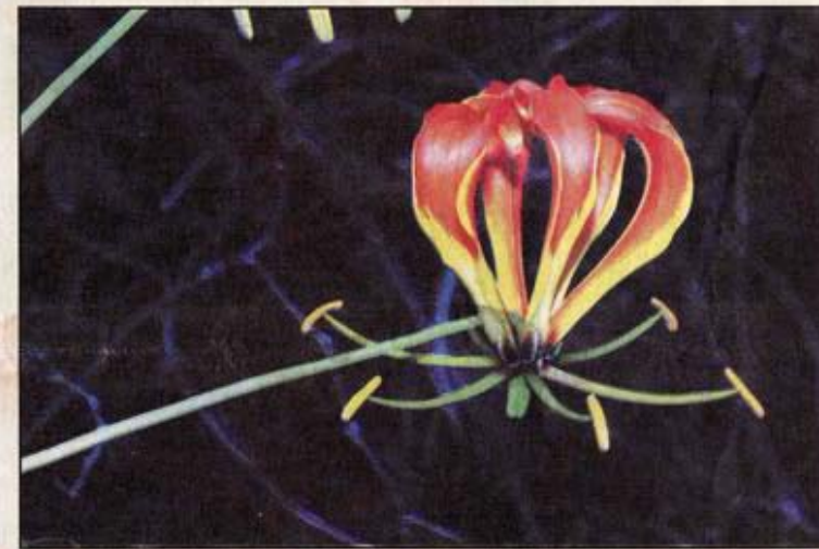
'n Vlamlelie ( Gloriosa superba ), een van die spesies wat tans met 'n DNS-strepieskode vir identifikasiedoeleindes toegerus word.

Daar is aanduidings dat dié DNS-data plantspesies se evolusionêre "familieboom" in dié park behoorlik op sy kop gaan keer, sê Van der Bank. 'n Paar nuwe spesies is vermoedelik reeds ontdek en word tans beskryf. Al bogenoemde geskied danksy tegnologie waarmee plante se genetiese "vingerafdrukke" bepaal word. Navorsers "rits" plante se DNS-stringe af met behulp van onder meer temperatuurskommelings en ensieme en dupliseer gedeeltes daarvan. Dan kan hulle die volgorde van DNS-molekules, die bou-blokke van dié stringe, met 'n perperduur rekenaar "lees". Dié data word in 'n DNS-bank by 'n temperatuur van -80°C geberg. Sulke genetiese studies is onder meer nuttig vir navorsing en om bewaringsprioriteite te help vasstel, sê Van der Bank. Dit kan ook met groot sukses ingespan word om plantstropers – byvoorbeeld dié wat skaars broodbome wegdra – aan te keer. Dié strepieskodes kan