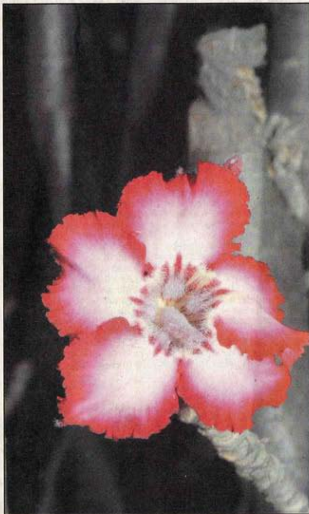
'n Impalalelie ( Adenium multiforum ) versamel in die suidelike gedeelte van die Krugerwildtuin naby Berg-en-Dal.